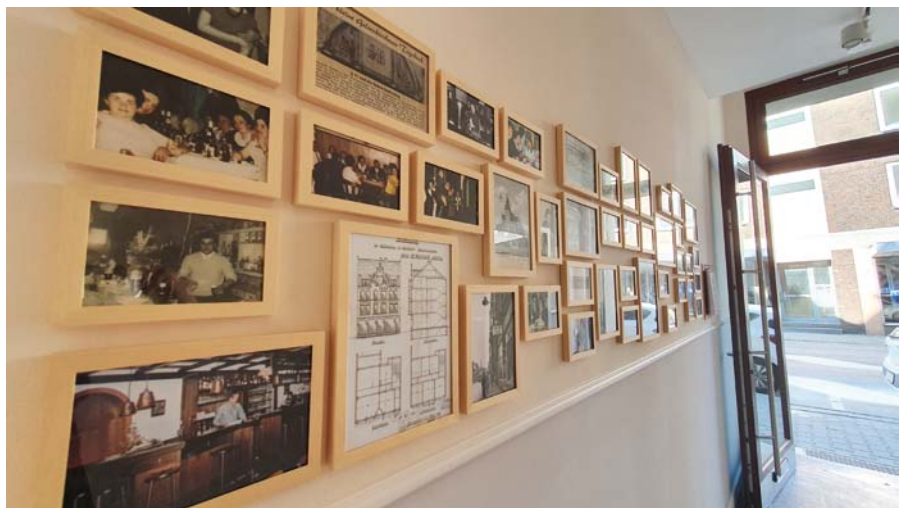
Die „Wand der Erinnerung“ gleich hinter der Tür zum Treppenhaus versammelt Bilder und mehr aus der Geschichte des Hauses.

Der Aufstieg im hellen Treppenhaus ermöglicht den einen oder anderen Blick auf den brandneuen Hinterhof, der auf die gemütliche Terrasse des Café Ütelier einlädt. Dieses ist seit Juni in die unterste Etage eingezogen – direkter Nachbar ist das Stadtteilbüro mit vielen Informationen und Angeboten rund um Gelsenkirchen und im Speziellen natürlich Ückendorf.